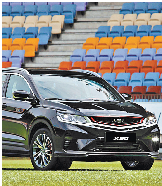
В новом белорусском кроссовере есть комплектующие и российский производства. → 3

Но все не так просто. И в России, и в Беларуси взять отпуск по уходу за ребенком может любой член семьи. Однако из года в год статистика по отцам, ушедшим в такой отпуск, показывает крошечные цифры — всего один-два процента. В патриархальной семейной модели сидеть с детьми — это не мужское дело. Поэтому мы видим и вторую, противоположную тенденцию: укрепляется и патриархальная модель с жестко закрепленными ролями мужской-добытчика и женщины — хранительницы домашнего очага. Функция воспитания детей в этой модели ложится на женщину. → 3